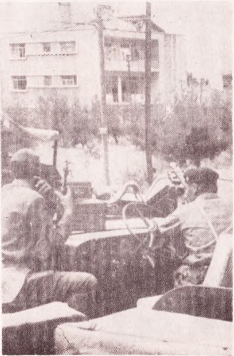
Maltepedeki evin daha yakından başka bir görünümü