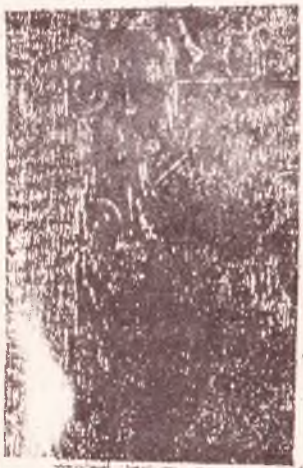
Yeni çıkan köşellerde bulunan binbaşının kızını tuttuğu ve elrom sanıklarının aranıldığı görülüyor. (A. H. H. H.)