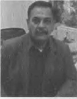
Bir profil resmi.