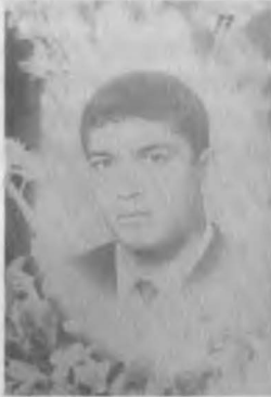
Lise yıllarından bir resim