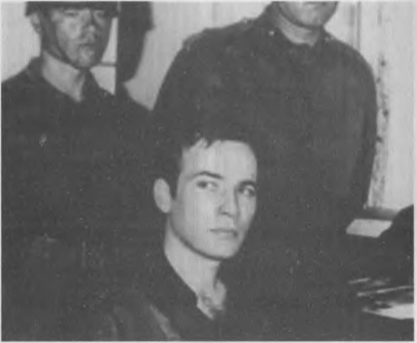
Mahir Çayan bir yargılanma anında.