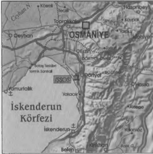
Kuzeyden güneye Amanos Dağlarından bir bölüm.