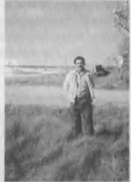
Kırda bir gezinti anı.