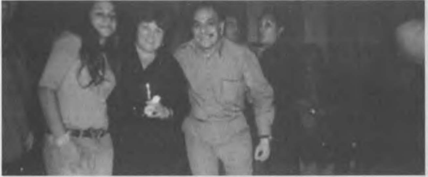
1990 larda Che Guevera'nın kızı Aleyda Guevera dahil bir gurup 'bir başka dünya mümkündür' adlı dünya konferansı .Ortada ki Aleyda Guevera ve İbrahim Çenet