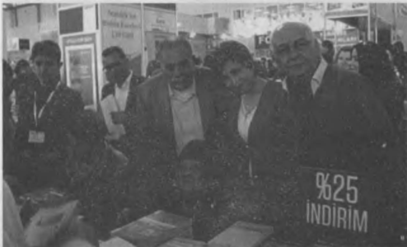
Adana kitap fuarında ünlü Sümerolog ve kültür tarihi uzmanı Muazzez İlmiye Çığ ve kızı Esin Çığ kitap fuarında. Arka fonda ki İbrahim Çenet, Filiz Toprak ve Dursun Özden.