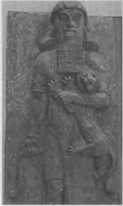
Gilgameş (Bilgameş ) Mühür – Heykel. Beş bin yıl önce ki yapılmış şekliyle.