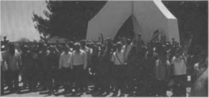
Mersin de barış ormanı ve üç fidan anıtı önü. Bir anma durumu.