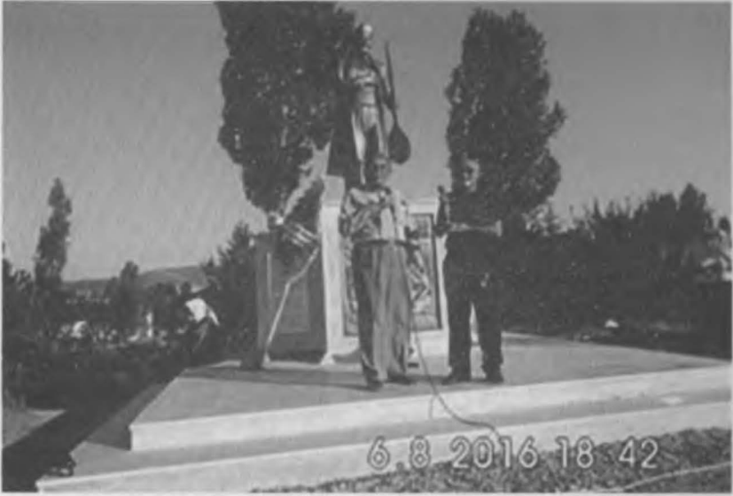
Türkiyenin adeta özgür bir kasabası Bahadın ( Yozgat, Sorgun ) 2016 yılı da Bahadında bir açılış ve tören. 250 yıl kadar önce Bahadında yaşamış Aşık Kul İbrahim anıtı törenle açılıyor. Haydar Eroğlu, İbrahim Çenet.