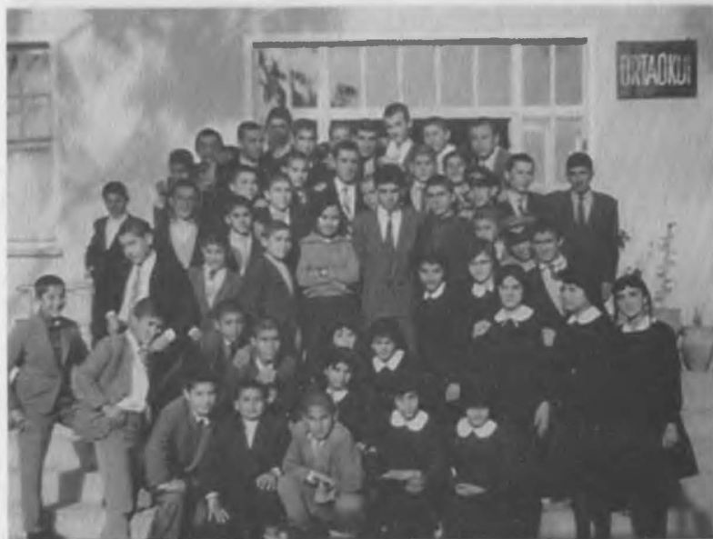
Osmaniye ortaokulu 2. Sınıf; sol alttan 2. Sırada ki koyu renk ceketli