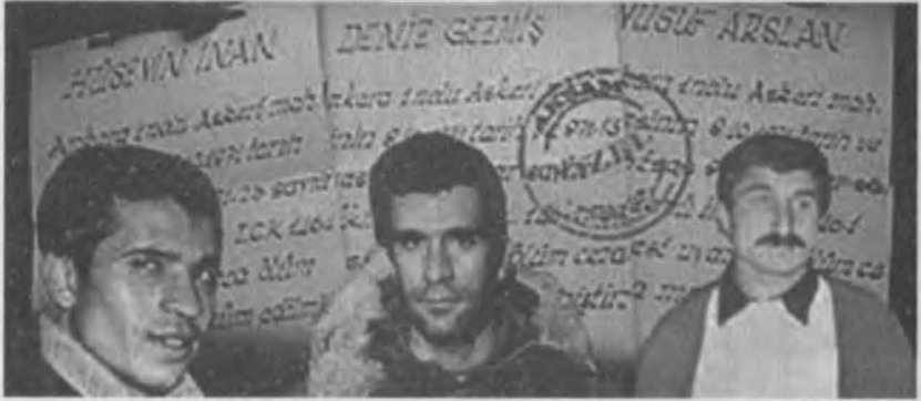
6 Mayıs 1972 de idam edilen Deniz Gezmiş, Hüseyin İnan ve Yusuf Arslan.