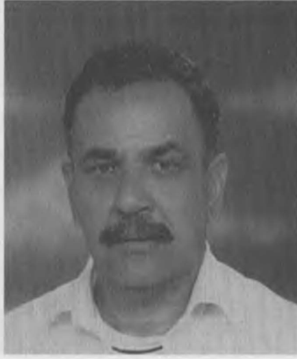
52 yaşında ve ülkeye sürgünden yeni döndüğü zaman.