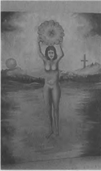
Amon – Aman – Amen – Amin'in 70 x 100 cm yağlı boya resmi.