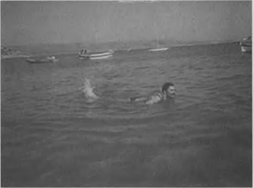
1990 yılına doğru adalardan Yunanistan'a yüzerek geçtiği an.