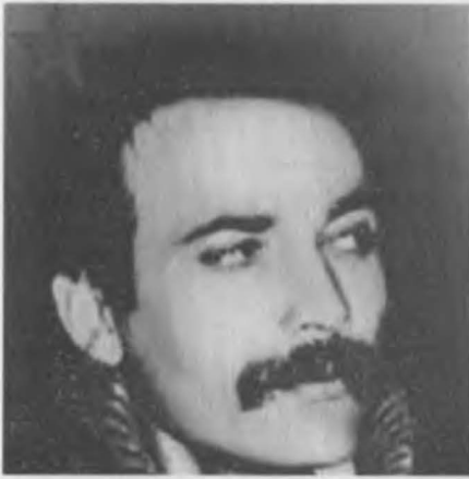
THKP-C 'nin kurucu ve ilk genel sekreteri Mahir Çayan.