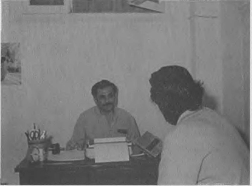
Yunanistan'da bulunduğu sürede çalışma odası ve Yunan tv sine röportaj verirken.