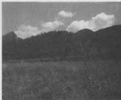
Halk Bilim Akademisi uzaktan görünüm.