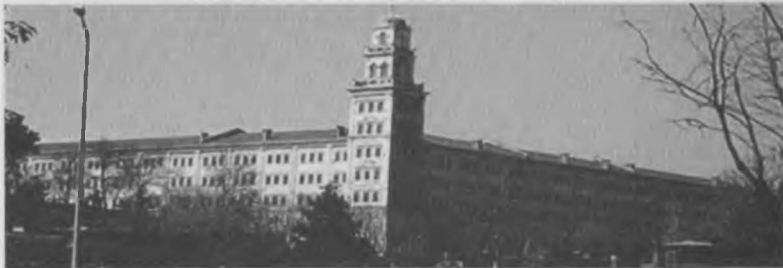
1074 yılında İstanbulda kale- kışla olarak inşa edilen, çok amaçla kullanılan , son elli ( 50 ) yılda da toplama kampı, işkence ve sorgu yeri , askeri mahkeme vb. kullanılan devasa bina.