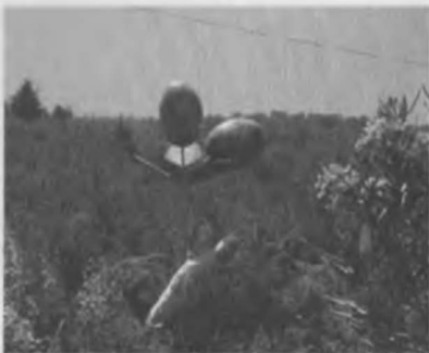
Halk Bilim Akademisi bahçesinde bir zeytin heykeli