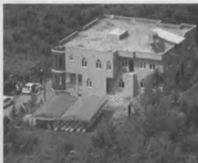
Halk Bilim Akademisi uzaktan görünüm