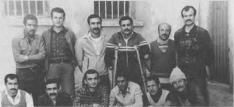
1983 yılı Niğde Cezaevi. Hükümlü koğuşu adı verdikleri bir koğuş ve arkadaşları.