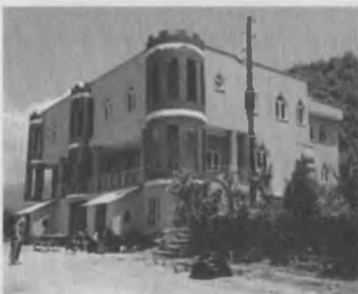
Halk Bilim Akademisi uzaktan görünüm