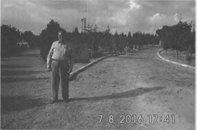
Nevşehir Hacıbektaş ilçesinde ki Bektaşî Veli eğitim- öğretim sisteminde ki 'Ozanlar Yolu'