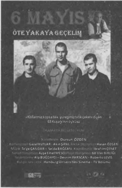
Bir belgesel film afişi.