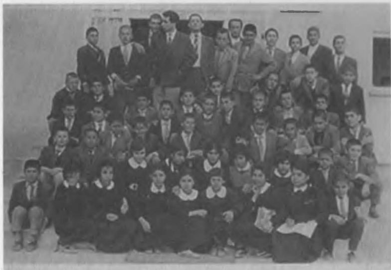
Osmaniye ortaokulu birinci sınıf. Sağdan ve alttan 2.sırada kareli ceketli