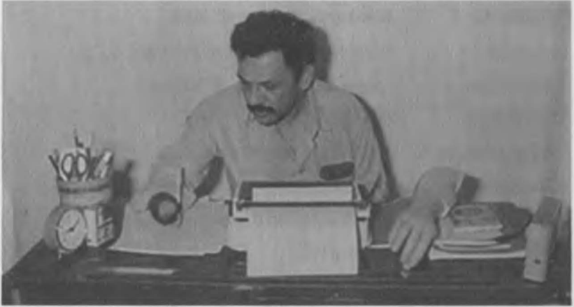
Yunanistanda çalışma masası. Daktilo ve yazma aracı.