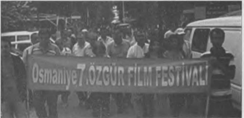
Osmaniye de bir film festivalinde sokaklarda sanat yürüyüşü yapılıyor.