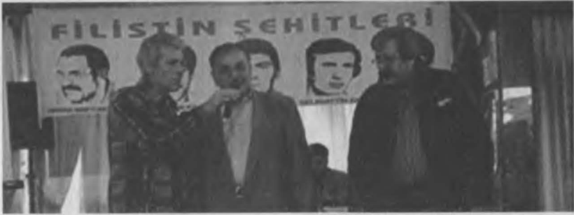
Antakya'da yapılan Devrim için toprağa düşenler anmasında , halka yapılan bir konuşma anından görüntü.