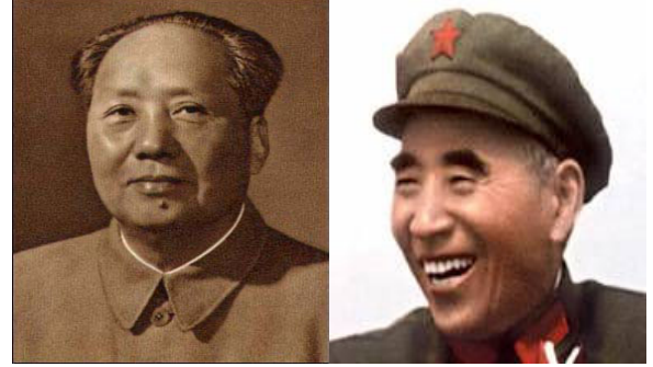
M.Zedung ve Lin Biao

Bu çeviri, Lin Biao, Report to the Ninth National Congress of the Communist Party of China (Peking, 1969) başlıklı İngilizce metin esas alınarak ve aynı metnin Türkçe ve Fransızca (Pekin, 1969) baskılarıyla karşılaştırılarak yapılmıştır.